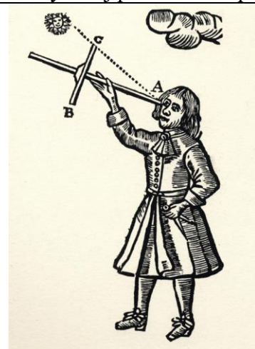
Laska Jakuba, drzeworyt, XVI w.

3. Wykonaj polecenia na podstawie ilustracji i wiedzy własnej.