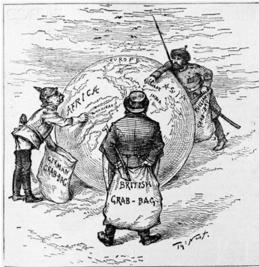
Karykatura amerykańska z 1885 r., zatytułowana: Grabieżcy świata . Na ilustracji są widoczne napisy: niemiecki worek, brytyjski worek i rosyjski worek .

A. Opisz zjawiska charakterystyczne dla polityki imperialnej, które piętnowali krytycy kolonializmu.