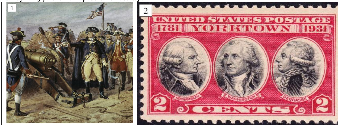
Ilustracja 2. przedstawia znaczek wydany z okazji 150. rocznicy ważnego wydarzenia z historii USA, a ilustracja 1. z XIX w. ukazuje scenę z tego wydarzenia.

6. Wykonaj polecenia na podstawie ilustracji.