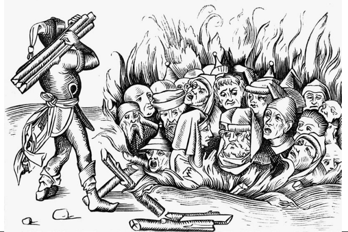
Drzeworyt z XV w. przedstawiający wydarzenie, do którego doszło w 1349 r. w Kolonii