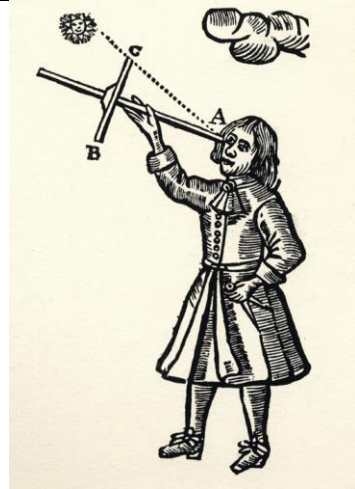
Laska Jakuba, drzeworyt, XVI w.

VI. Wykonaj polecenia na podstawie ilustracji i wiedzy własnej.