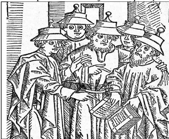
Drzeworyt z XV w. przedstawiający dyskusję średniowiecznych uczonych

IV. W oparciu o ilustracje i tekst podręcznika s. 53 i 55-56 odpowiedz na pytania.